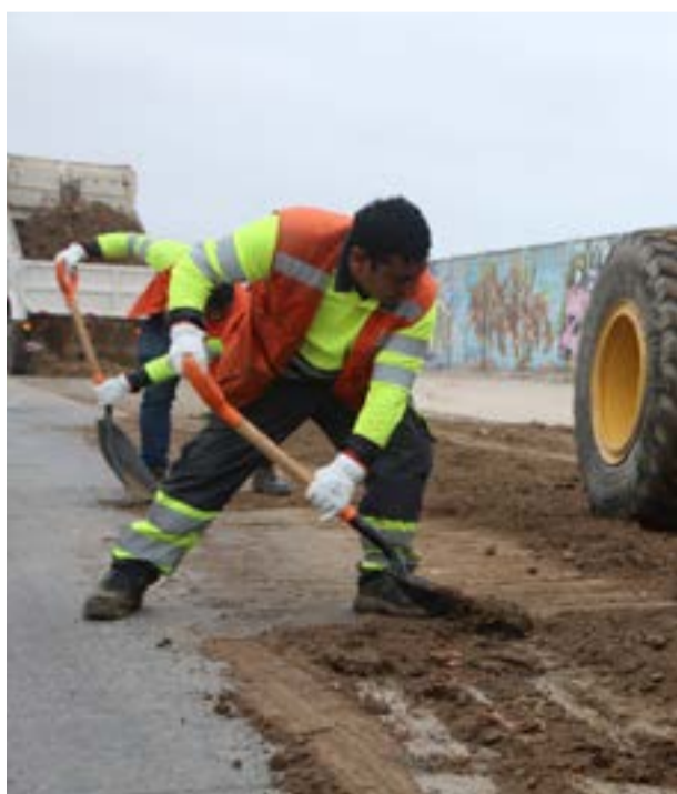
PAVIMENTACIÓN BENEFICIARÁ A TODA LA COMUNA

CON PROYECTOS E INVERSIÓN MUNICIPAL COQUIMBO CRECE Y AVANZA AL FUTURO