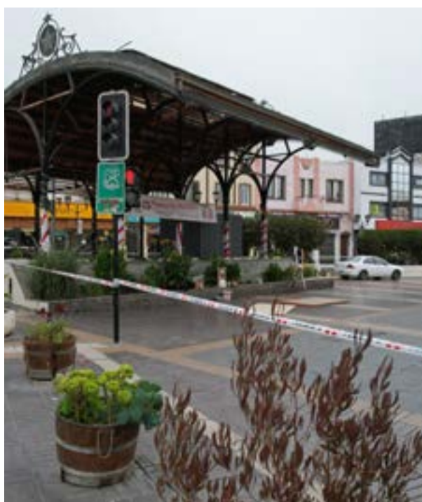
PASEO PEATONAL EN CALLE ALDUNATE