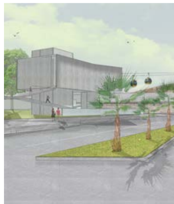
INVERSIONES A FUTURO: COQUIMBO 2030